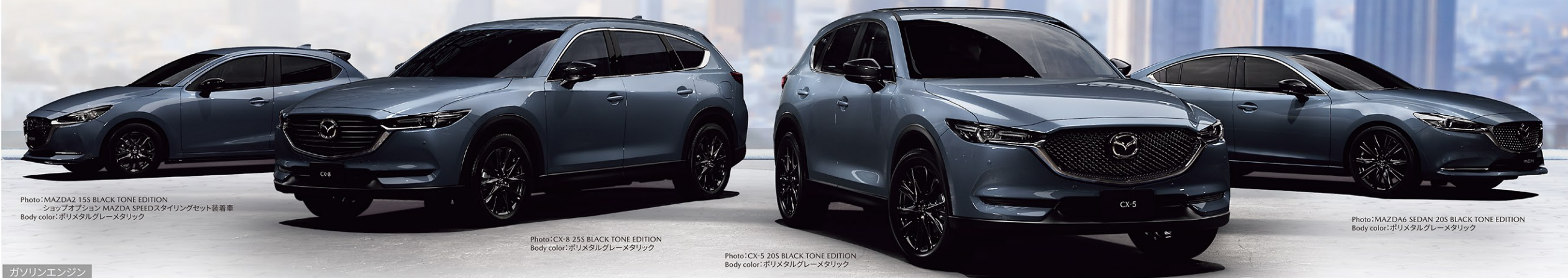
Photo: MAZDA2 15S BLACK TONE EDITION ショップオプション MAZDA SPEEDスタイリングセット装着車 Body color: ポリメタルグレーメタリック