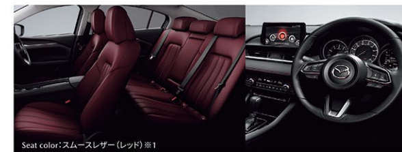
Seat color: スムースレザー (レッド) ※1

MAZDA6 SEDAN 20S ブラックトーンエディション | MAZDA6は (20S 2WD) 車両本体価格 (消費税込) ¥3,283,500 | 車両本体価格 (消費税込) ¥2,893,000~ SKYACTIV-G 2.0/6速AT/2WD (FF) [K32-32-0]