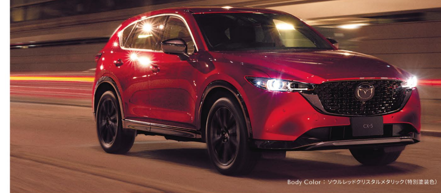
Body Color: ソウルレッドクリスタルメタリック(特別塗装色)