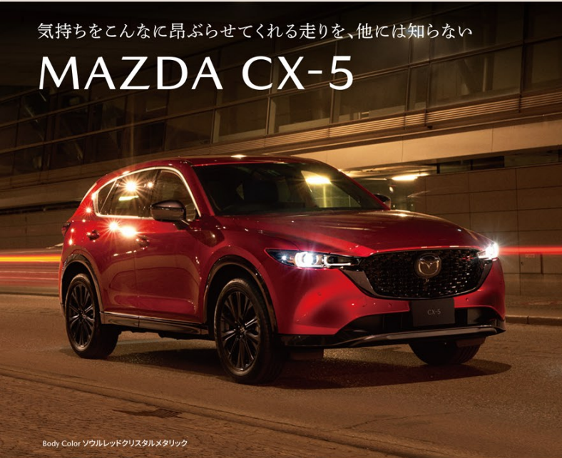
Body Color ソウルレッドクリスタルメタリック