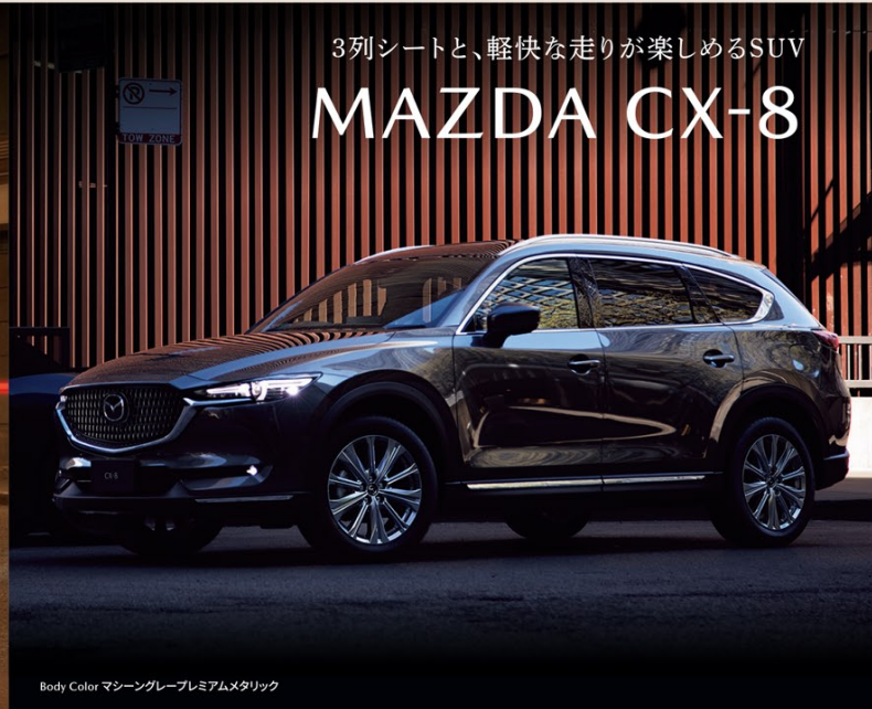
Body Color マシーングレープレミアムメタリック