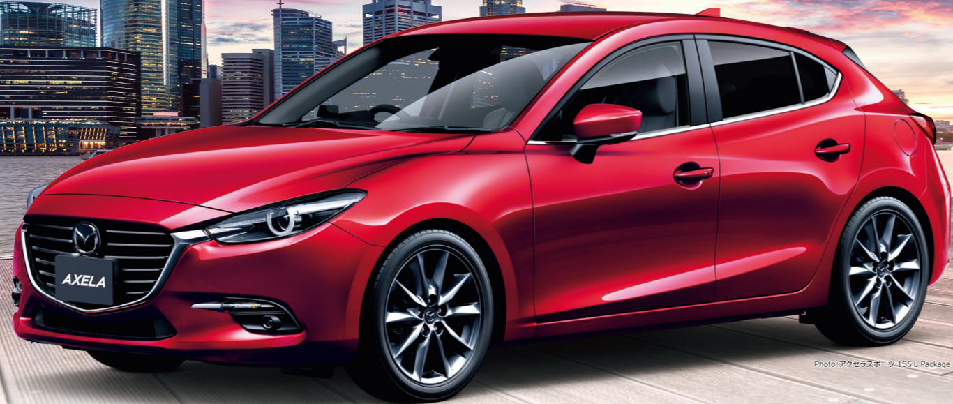
Photo:アクセラスポーツ 15S L Package

アクセラ全グレードに先進安全技術を標準装備。「セーフティ・サポートカーS(サポカーS)」のワイドに適應して登場。