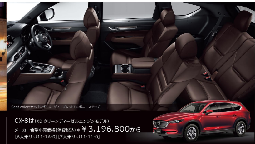
Seat color: ナッパレザー※・ディーブルッド(エボニー・ステッチ)

エンジン SKYACTIV-D 2.2 トランスミッション SKYACTIV-DRIVE 乗車定員 6人 or 7人 全長 4,900×全幅 1,840×全高 1,730(mm)