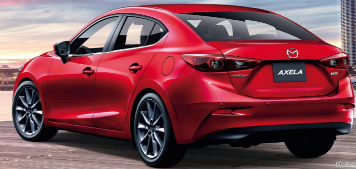
Photo:アクセラセダン 15XD L Package