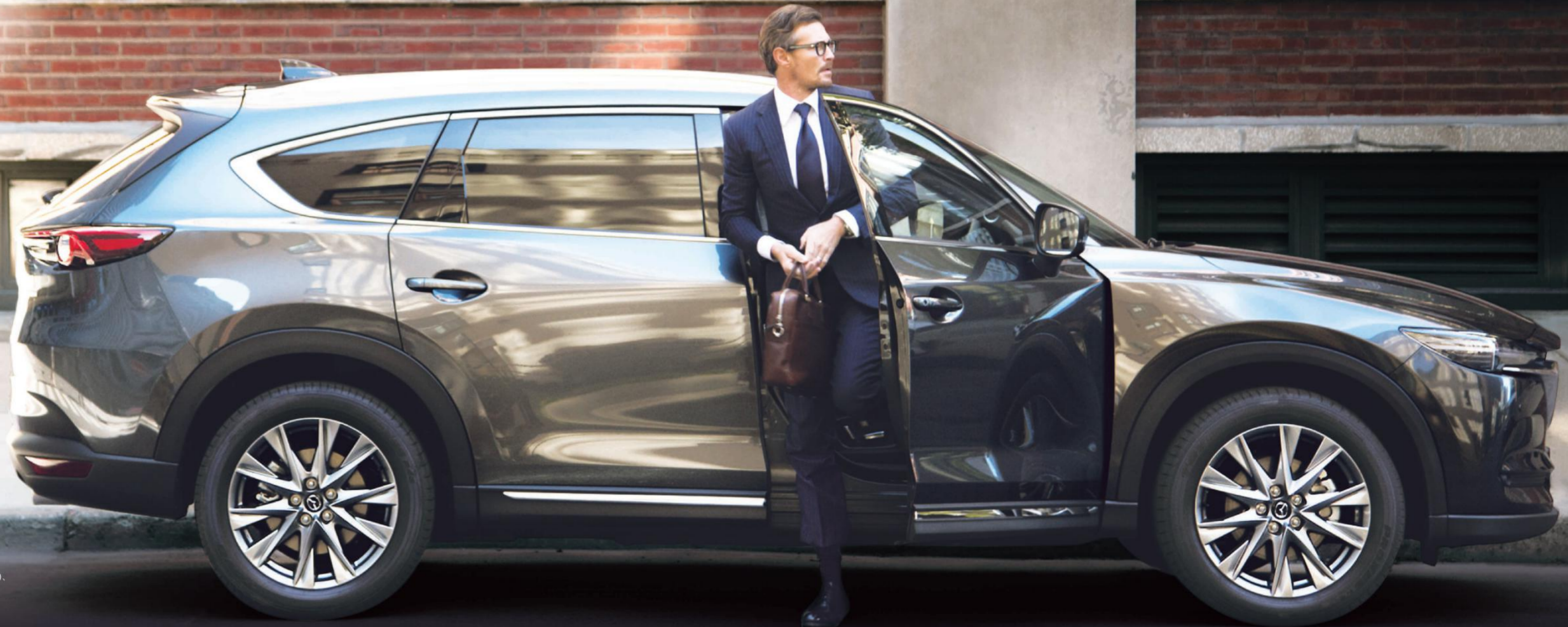
Photo: CX-8 XD L Package [6人乗り / クリーンディーゼル] Body Color: マシニンググレープレミアムメタリック メーカーセットオプション: CD/DVDプレーヤー+地上デジタルTVチューナー(フルセグ)、 Bose®サウンドシステム(AUDIOPILOT™2+Centerpoint™2)+10スピーカー、 360°ビュー・モニター+フロントパーキングセンサー(センター/コーナー) メーカー希望小売価格(消費税込) * ¥4,168,800 SKYACTIV-D 2.2 / SKYACTIV-DRIVE / 2WD [6人乗り: J31-3E-0] ※価格には、掲載色マシニンググレープレミアムメタリック [54,000円(税込)] が含まれています。 ※上記価格は、西四国マツダの価格です。価格は各社独自に定めておりますので、それぞれの各社へお問い合わせください。