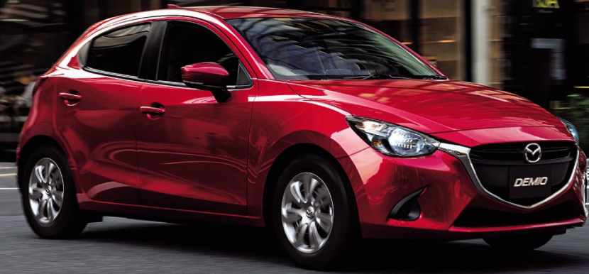
BodyColor:ソウルレッドクリスタルメタリック(特別塗装色)