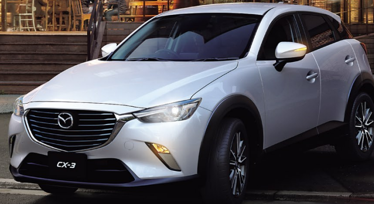
BodyColor:セラミックメタリック