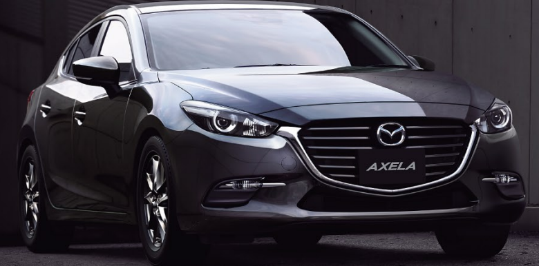
BodyColor:マシニンググレープレミアムメタリック(特別塗装色)

1.3L高効率直噴ガソリンエンジン DEMIO 13S SKYACTIV-G 1.3 / 2WD(F) / 6EC-AT (V22-21-0)