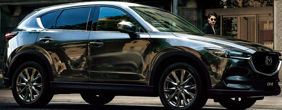
BodyColor: マシングレープレミアムメタリック (特別塗装色)

2.5Lガソリンターボエンジンモデルをはじめとした多彩なラインナップで、進化したCX-5をお届けします。