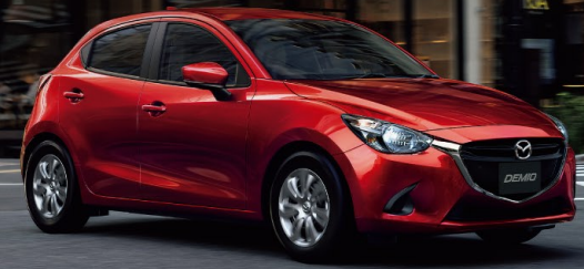
BodyColor: ソウルレッドクリスタルメタリック (特別塗装色)