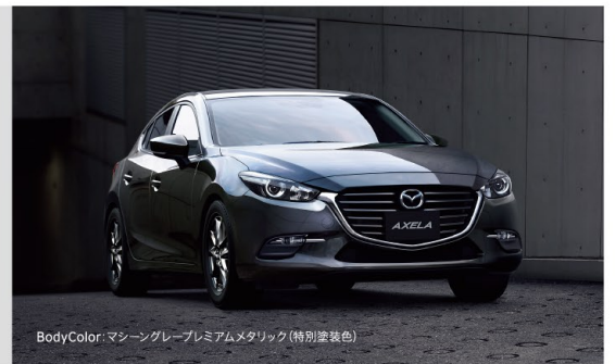
BodyColor: マシングレープレミアムメタリック (特別塗装色)

おクルマの将来の残価を保証し、月々のお支払いを軽減。SKYACTIV TECHNOLOGY搭載車専用クレジット