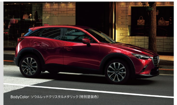
BodyColor: ソウルレッドクリスタルメタリック (特別塗装色)