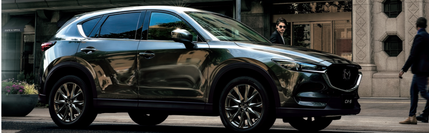
Photo: 特別仕様車 25T Exclusive Mode 2WD Body color: マシニンググレープレミアムメタリック