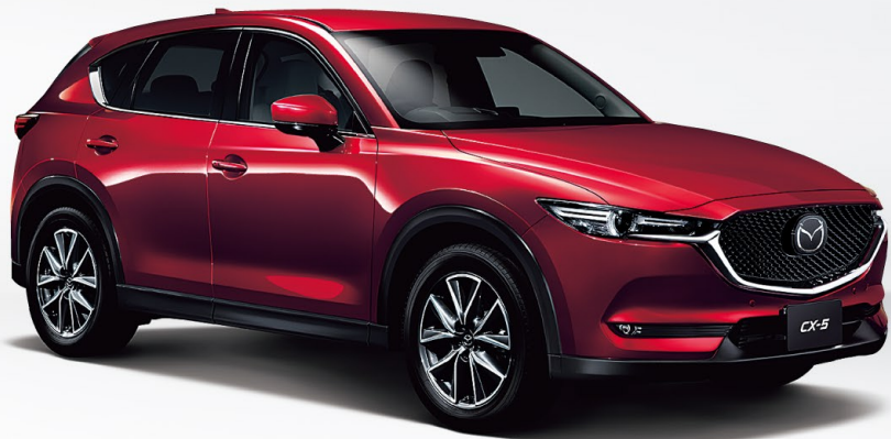
Body Color:ソウルレッドクリスタルメタリック

卓越した走りを見せるCX-5のパートレインに、2.5Lガソリンターボエンジンが新登場。