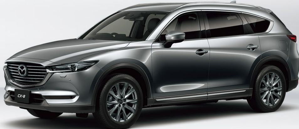
Body Color:マシーングレープレミアムメタリック