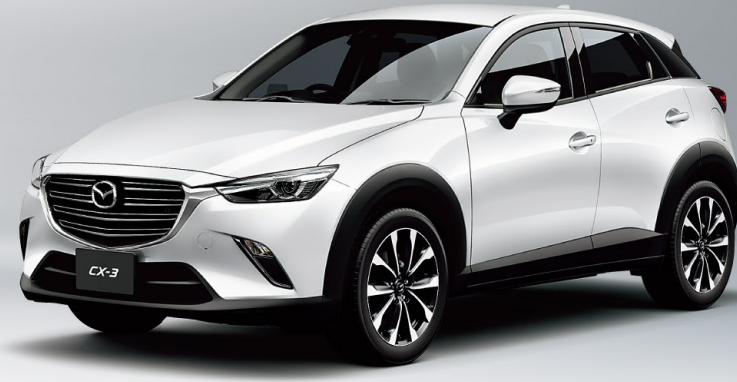
Body Color:スノーフレイクホワイトパールマイカ