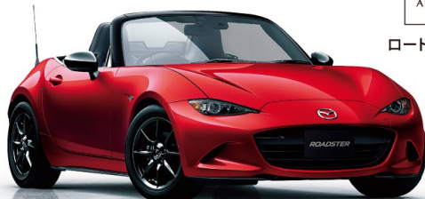
Body Color:ソウルレッドクリスタルメタリック

※上記の価格は、ソウルレッドクリスタルメタリック(特別塗装色/64,800円[消費税込])の価格が含まれています。