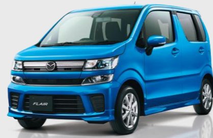
Body color: プリンスブルーメタリック