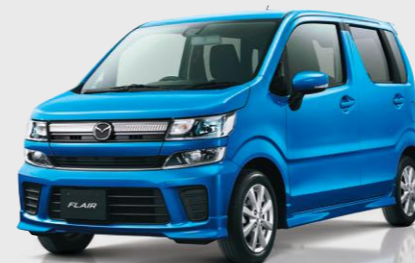
Body color: プリンスブルーメタリック