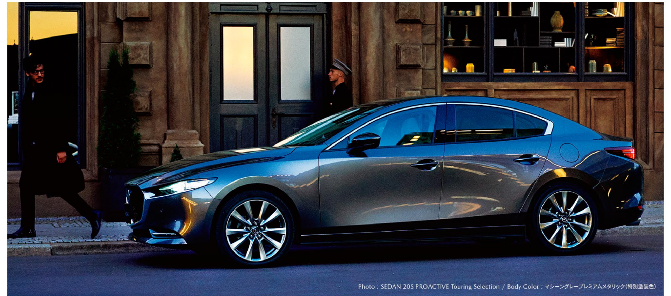
Photo: SEDAN 20S PROACTIVE Touring Selection / Body Color: マシングレープレミアムメタリック(特別塗装色)