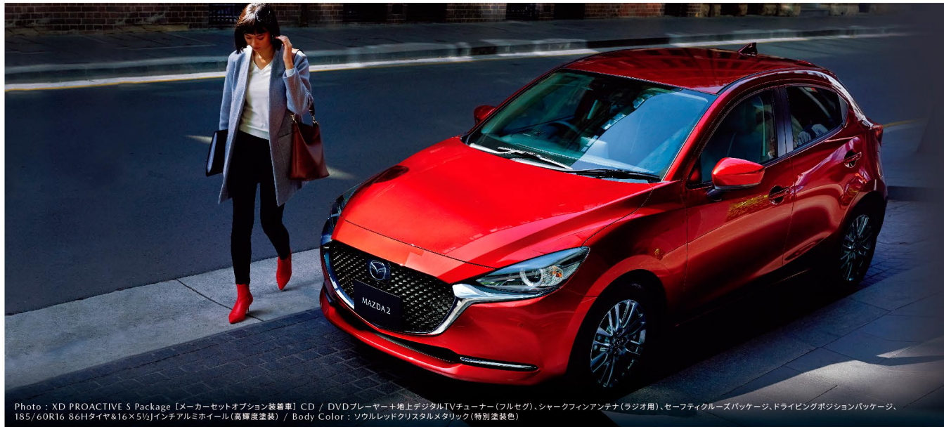
Photo: XD PROACTIVE S Package [メーカーセットオプション装着車] CD / DVDプレーヤー+地上デジタルTVチューナー(フルセグ)、シャークフィンアンテナ(ラジオ用)、セーフティクルーズパッケージ、ドライビングポジションパッケージ、185/60R16 86Hタイヤ&16×5Jインチアルミホイール(高輝度塗装) / Body Color: ソウルレッドクリスタルメタリック(特別塗装色)