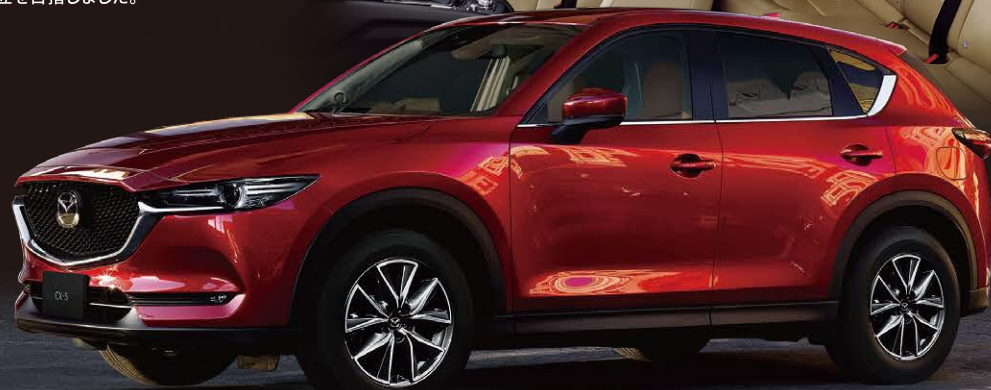
Body Color : ソウルレッドクリスタルメタリック (特別塗装色)

CX-5のPROACTIVEグレードをベースに 新色のシルクベージュカラーのハーフレザレットシートを 採用。スウェード調生地グランリクス®を採用することで 機能性と上質さの両立を目指しました。