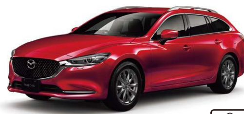
Body Color : ソウルレッドクリスタルメタリック (特別塗装色)