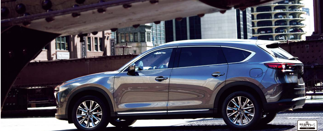
Body Color : マシングレープレミアムメタリック (特別塗装色)