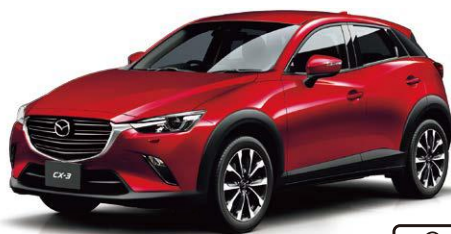
Body Color : ソウルレッドクリスタルメタリック (特別塗装色)