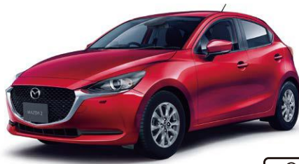
Body Color : ソウルレッドクリスタルメタリック (特別塗装色)