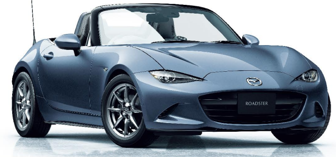
Body Color：ポリメタルグレーメタリック