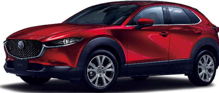
Body Color：ソウルレッドクリスタルメタリック(特別塗装色)

20S [ガソリンエンジン搭載モデル] SKYACTIV-G 2.0 / 2WD / 6EC-AT / E13-11-0