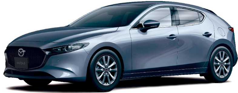
Body Color：ポリメタルグレーメタリック

FASTBACK 15S [ガソリンエンジン搭載モデル] SKYACTIV-G 1.5 / 2WD / 6EC-AT / R02-11-0