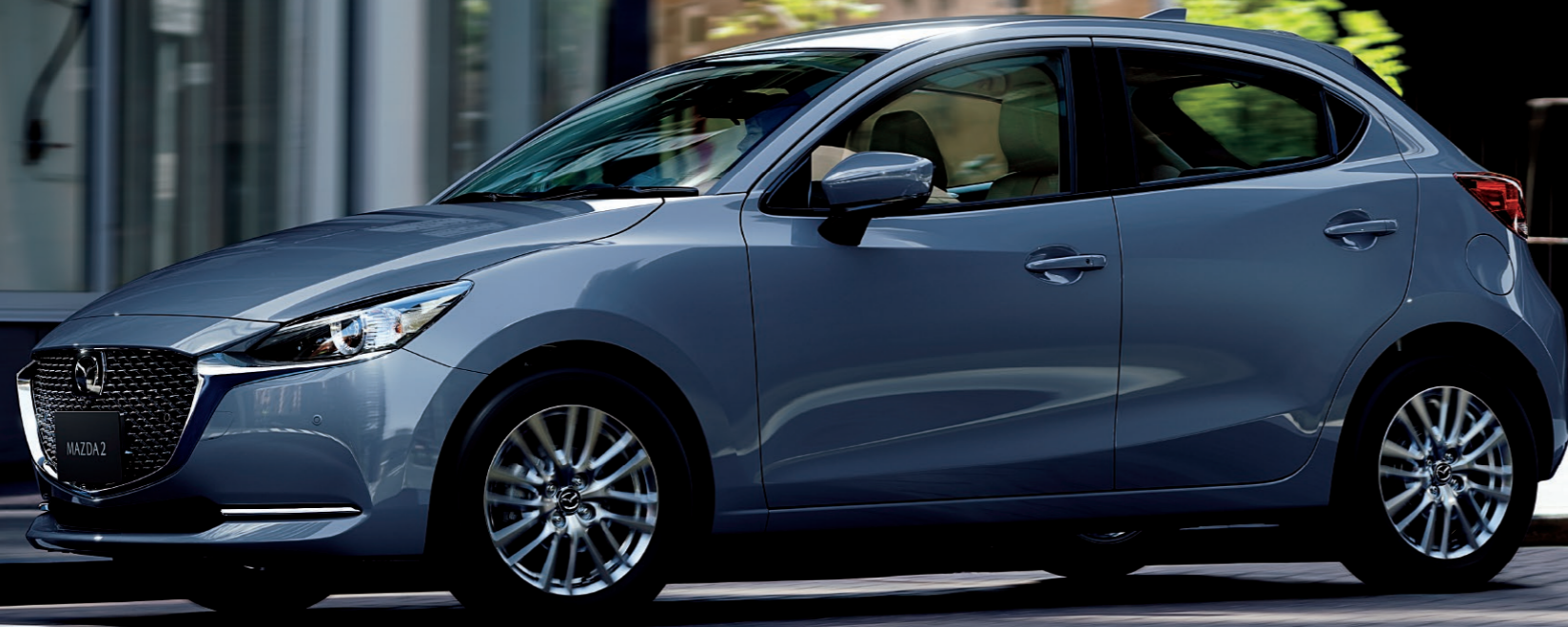
Body Color: ポリメタルグレーメタリック

ホワイトレザーがクールで、ウォームグレーのファブリックが モダンインテリアのような温もりを感じさせる新しいコンパクトカー。