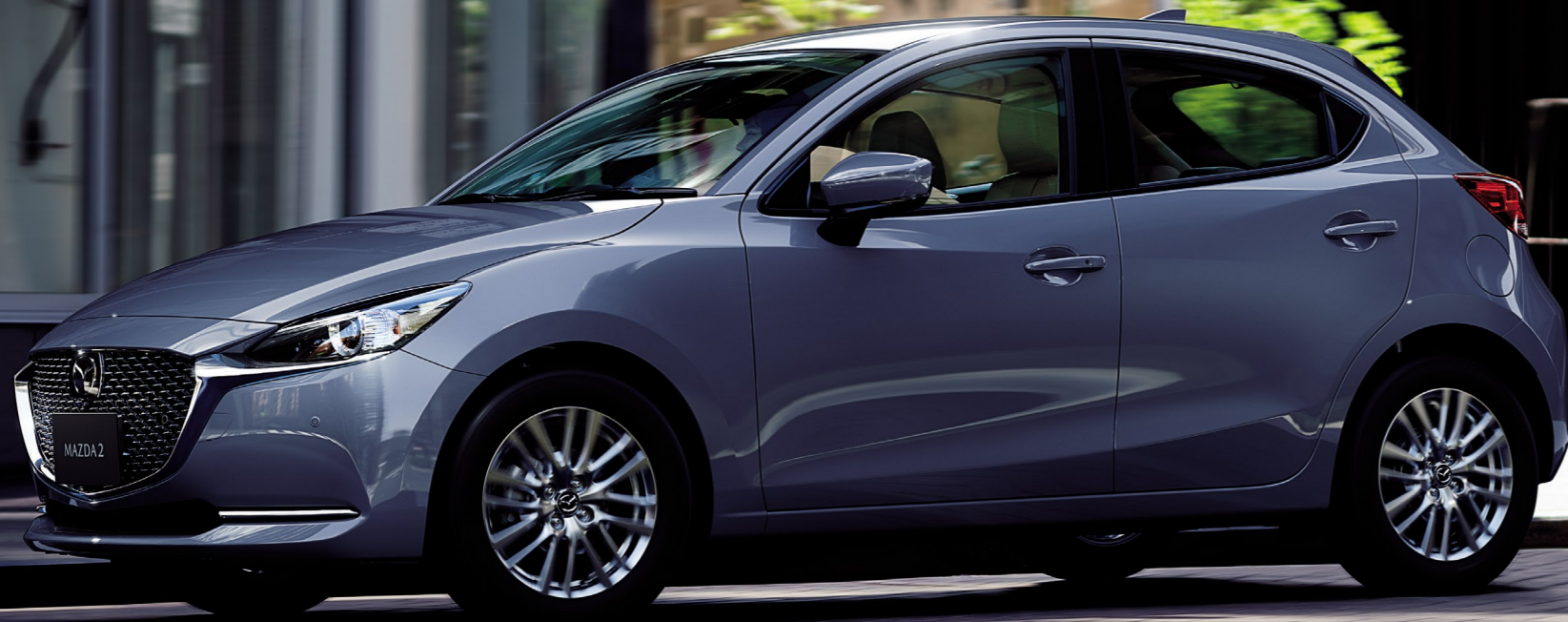
Body Color: ポリメタルグレーメタリック

ホワイトレザーがクールで、ウォームグレーのファブリックが モダンインテリアのような温もりを感じさせる新しいコンパクトカー。