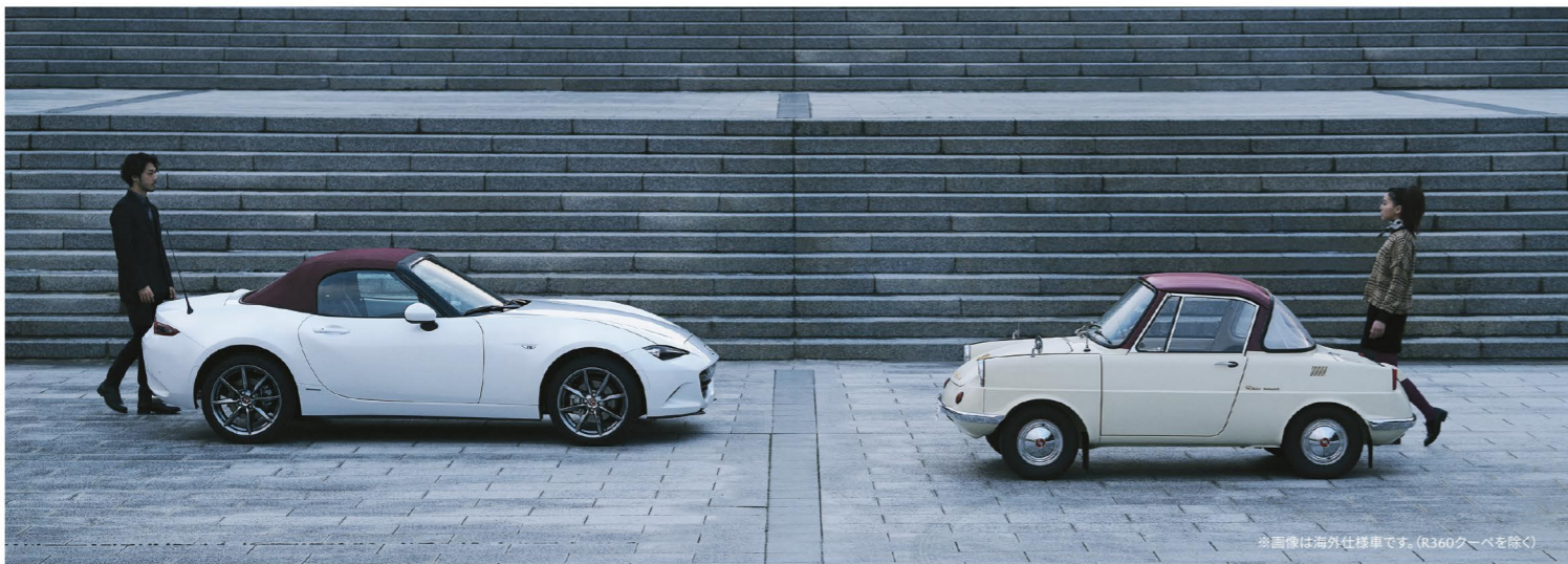
※画像は海外仕様車です。(R360クーペを除く)