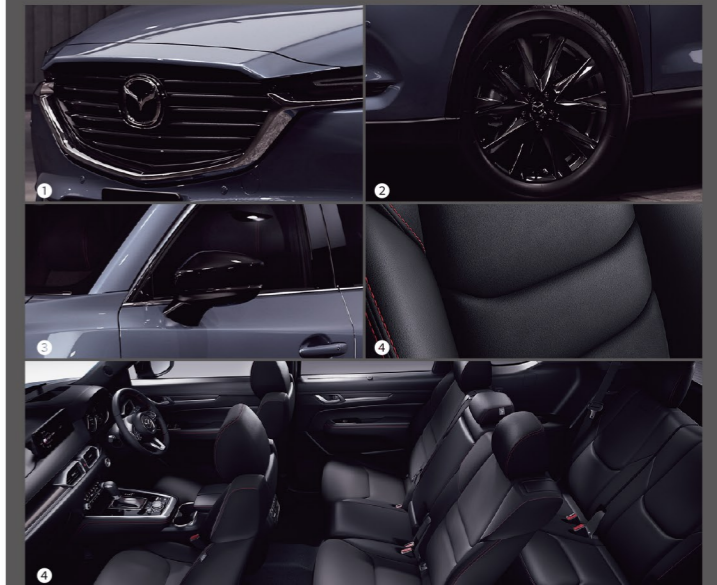
Photo: CX-8 XD BLACK TONE EDITION

黒で引き締めたエクステリア。黒を基調としながら、赤の差し色によりスポーティさを増したインテリア。