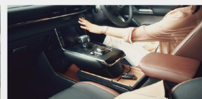
フローティングがテーマのインテリア空間