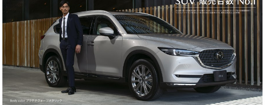
Body color: プラチナフォーツメタリック