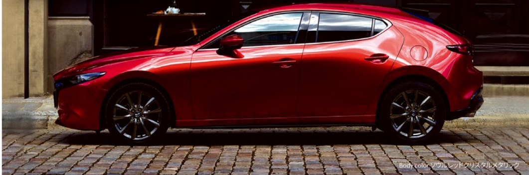
Body color: ソウルレッドクリスタルメタリック