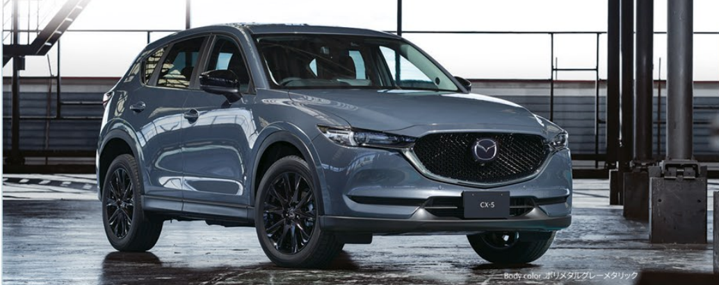
Body color: ホリメタルグレーメタリック