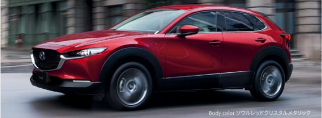
Body color: ソウルレッドクリスタルメタリック