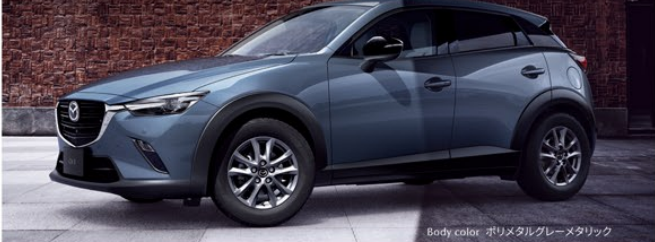
Body color: ホリメタルグレーメタリック