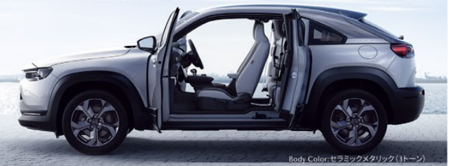
Body Color: セラミックメタリック(トーン)

MX-30 Basic・Safety・360°Safety・Utility・Modern Confidence Package