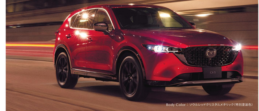
Body Color: ソウルレッドクリスタルメタリック(特別塗装色)