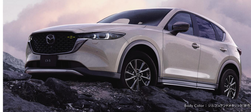
Body Color: ジルコンサンドメタリック(新色)