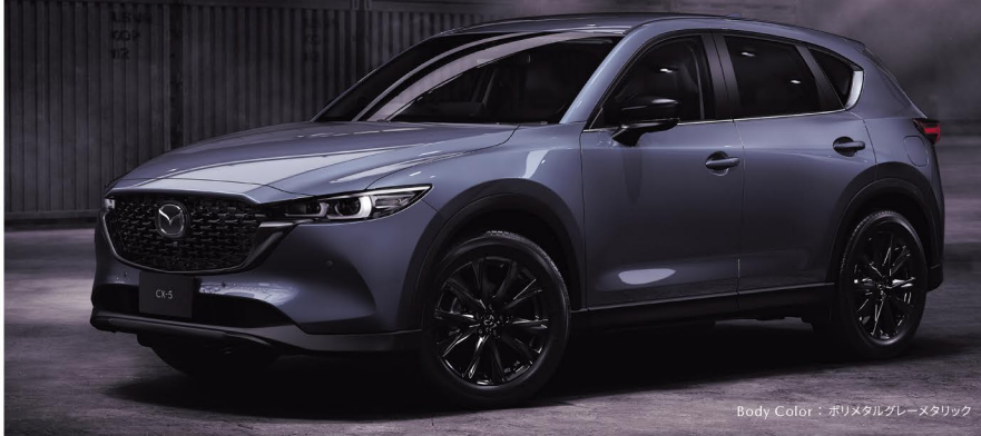
Body Color: ポリメタルグレーメタリック