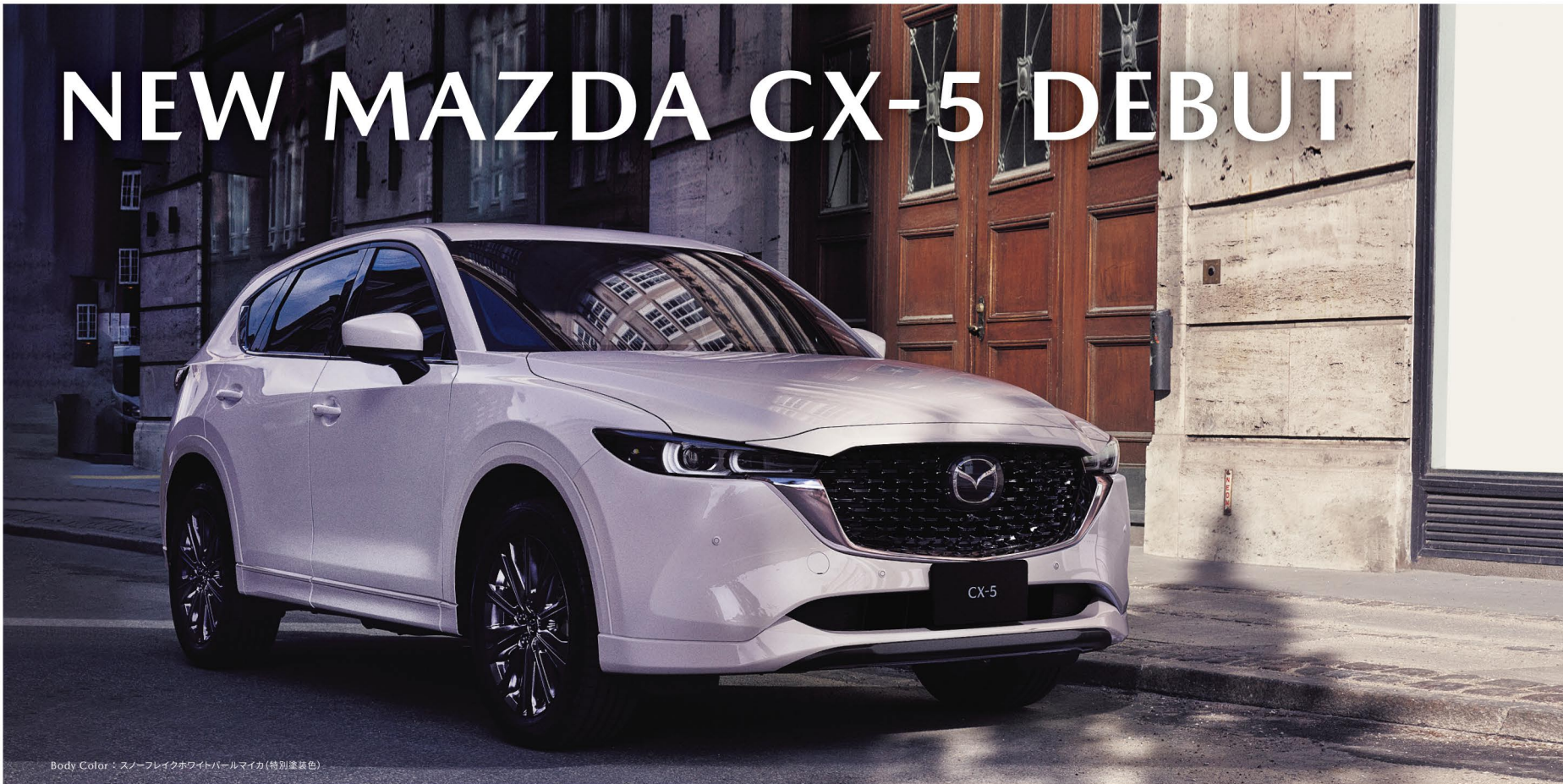
Body Color: スノーフレイクホワイトパールマイカ(特別塗装色)