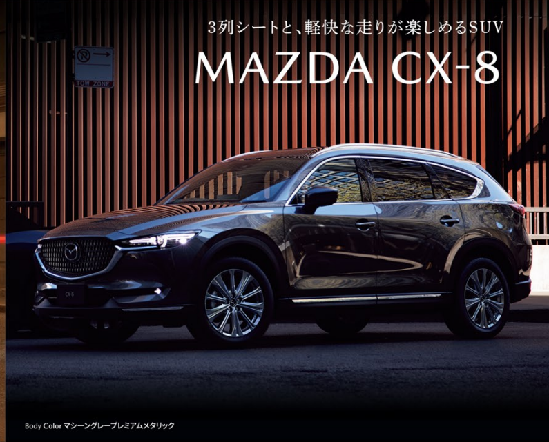
Body Color マシーングレープレミアムメタリック