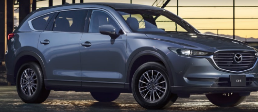
Body color ポリメタルグレーメタリック

全長 4,900mm 全幅 1,840mm 全高 1,730mm 最小回転半径 5.8m