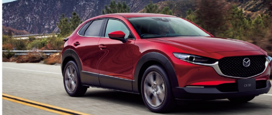
Body color ゴールドレッドクワスタルメタリック

全長 4,395mm 全幅 1,795mm 全高 1,540mm 最小回転半径 5.3m