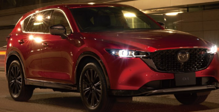
Body color ゴールドレッドクワスタルメタリック

全長 4,575mm 全幅 1,845mm 全高 1,690mm 最小回転半径 5.5m