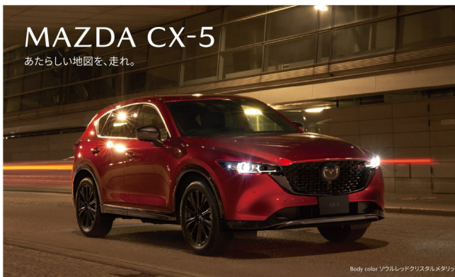
Body color ゴールドレッドクワスタルメタリック

全長 4,575mm 全幅 1,845mm 全高 1,690mm 最小回転半径 5.5m