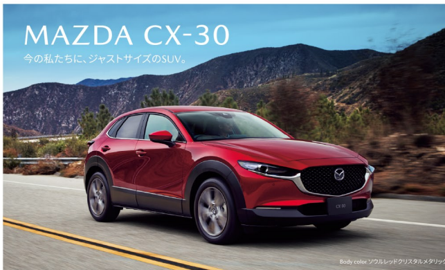
Body color ゴールドレッドクワスタルメタリック

全長 4,395mm 全幅 1,795mm 全高 1,540mm 最小回転半径 5.3m