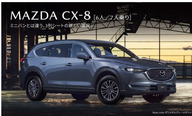
Body color ポリメタリックグレーメタリック

全長 4,900mm 全幅 1,840mm 全高 1,730mm 最小回転半径 5.8m