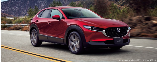
Body color ゴールドレッドクワスタルメタリック

全長 4,395mm 全幅 1,795mm 全高 1,540mm 最小回転半径 5.3m