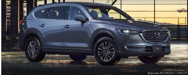
Body color ポリメタブルーグレーメタリック

全長 4,900mm 全幅 1,840mm 全高 1,730mm 最小回転半径 5.8m