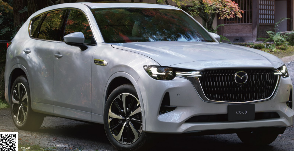
Photo CX-60 XD-HYBRID Premium Modern

※2022年9月の販売開始はe-SKYACTIV D搭載モデルです。その他モデルの販売開始は2022年12月を予定しています。