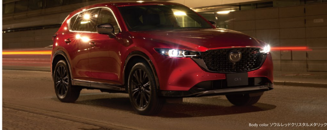
Body color ゴールドレッドクワスタルメタリック

全長 4,575mm 全幅 1,845mm 全高 1,690mm 最小回転半径 5.5m