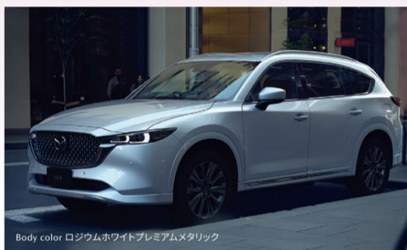
Body color ロジウムホワイトプレミアムメタリック

※マシニンググレープレミアムメタリックは特別塗装色のため、55,000円 (税込) 高。上記価格に含まれています。