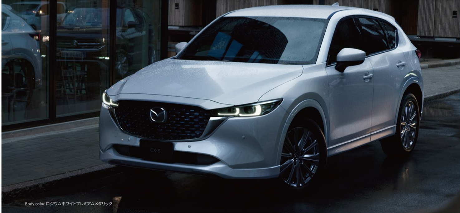
Body color ロジウムホワイトプレミアムメタリック