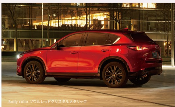
Body color ソウルレッドクリスタルメタリック