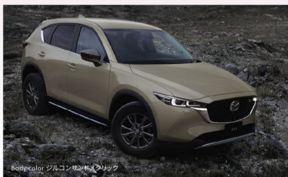
Body color ジルコンサンゴメタリック

※ソウルレッドクリスタルメタリックは特別塗装色のため、77,000円 (税込) 高。上記価格に含まれています。