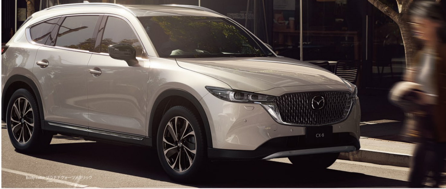
Body color プラチナオーソメタリック