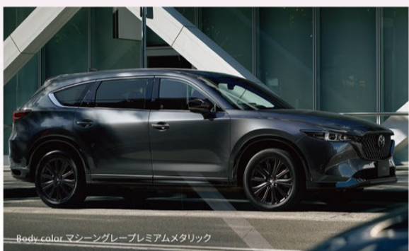
Body color マシニンググレープレミアムメタリック