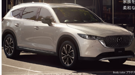
Body color アラチナホワイトメタリック