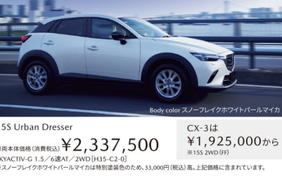
Body color スノーブレイクホワイトパールマイカ