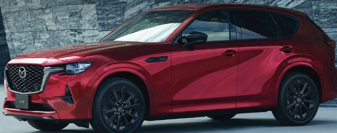
Body color ソウルレッドクリスタルメタリック

直列6気筒エンジン・FRプラットフォームで一体感をより強く楽しむハイパフォーマンスSUV