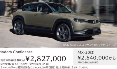
Body color ジェムコンサンドメタリック(クローン)