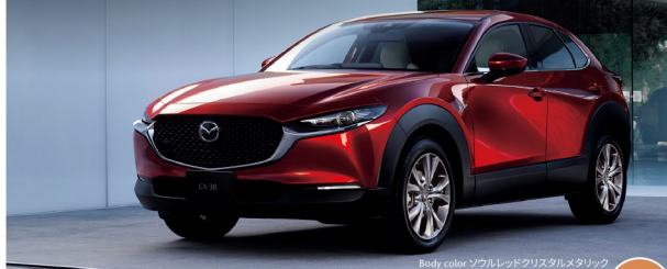
Body color ソウルレッドクリスタルメタリック