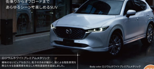
Body color ロジウムホワイトプレミアムメタリック

ロジウムホワイトプレミアムメタリック 雑味のないピュアな白さと、粒子のきめが細かく、肌による陰影表現を際立たせる金属質感を両立した特別塗装色を追加しました。