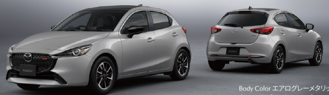
Body Color エアログレームタリック (ルーフはブラックフィルム)

専用メッシュグリルや16インチアルミホイールなどのブラック基調の装備によって、精悍な表情を作り出し、MAZDA2を一層スポーティに仕上げました。インテリアには、赤ステッチを差し色に加えた黒シートを採用。