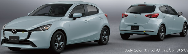
Body Color エアストリームブルーメタリック (ルーフはボディカラー同色)

BD とは「Blank Deck」の略。デザインが施されていない、無地のスケートデッキを指す言葉で、「まっさらな状態から、自分好みにアレンジできるベースとなるもの」という意味をグレード名に込めました。