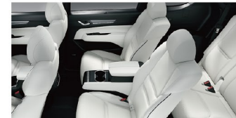
Body Color ロジウムホワイトプレミアムメタリック