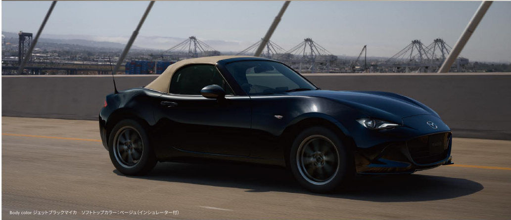
Body color ジェットブラックマイカ ソフトトップカラー=ベージュ(インシユレーター付)

さらに熟成した、NEWグレード S Leather Package V Selection 登場