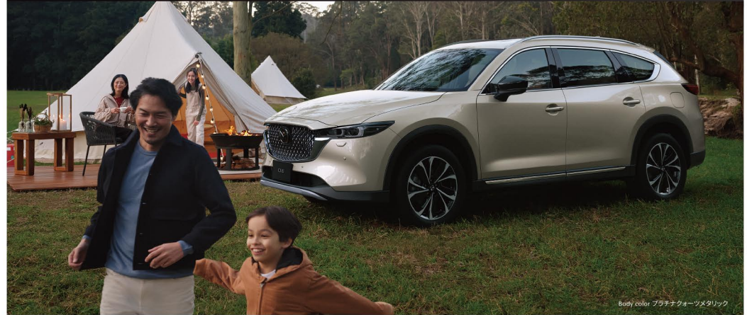
Body color ブラチネアウォーツメタリック

ご注文が、12月までの生産台数に達した時点で、販売終了となります。 上記の詳細につきましては、西四国マツダにお問い合わせください。