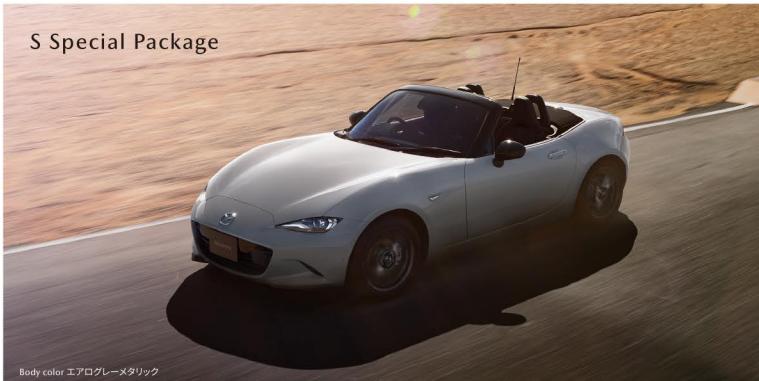
Body color エアログレーメタリック