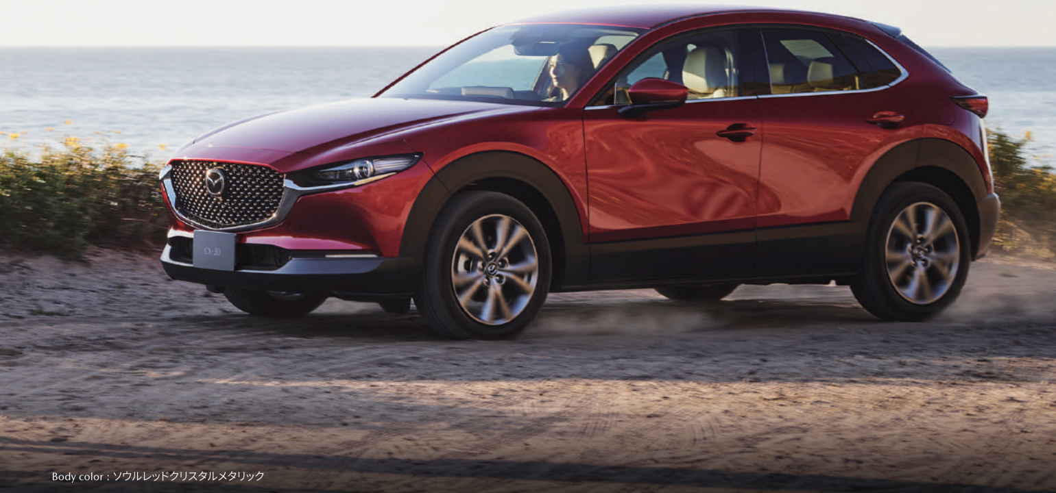
Body color : ソウルレッドクリスタルメタリック