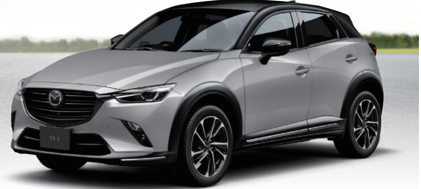
Body color エアログレーメタリック(ブラックキャビン)

色彩を抑えシックにまとめる中に大胆さを取り入れた、先進的なインテリアデザイン ※レガージュはセーレン株式会社の登録商標です。