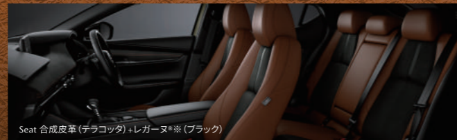
Seat 合成皮革(テラコッタ)・レガージュ※(ブラック)

【特別仕様車】 FASTBACK 20S Retro Sports Edition (ハイブリッド[e-SKYACTIV G]) 車両本体価格(消費税込) ¥2,984,300 e-SKYACTIV G 2.0/6速AT/2WD[R28-G1-0] セダンも ご用意しております