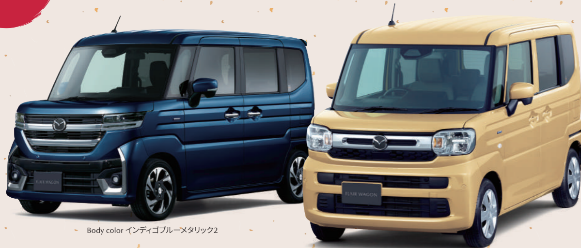
Body color インディゴブルーメタリック2