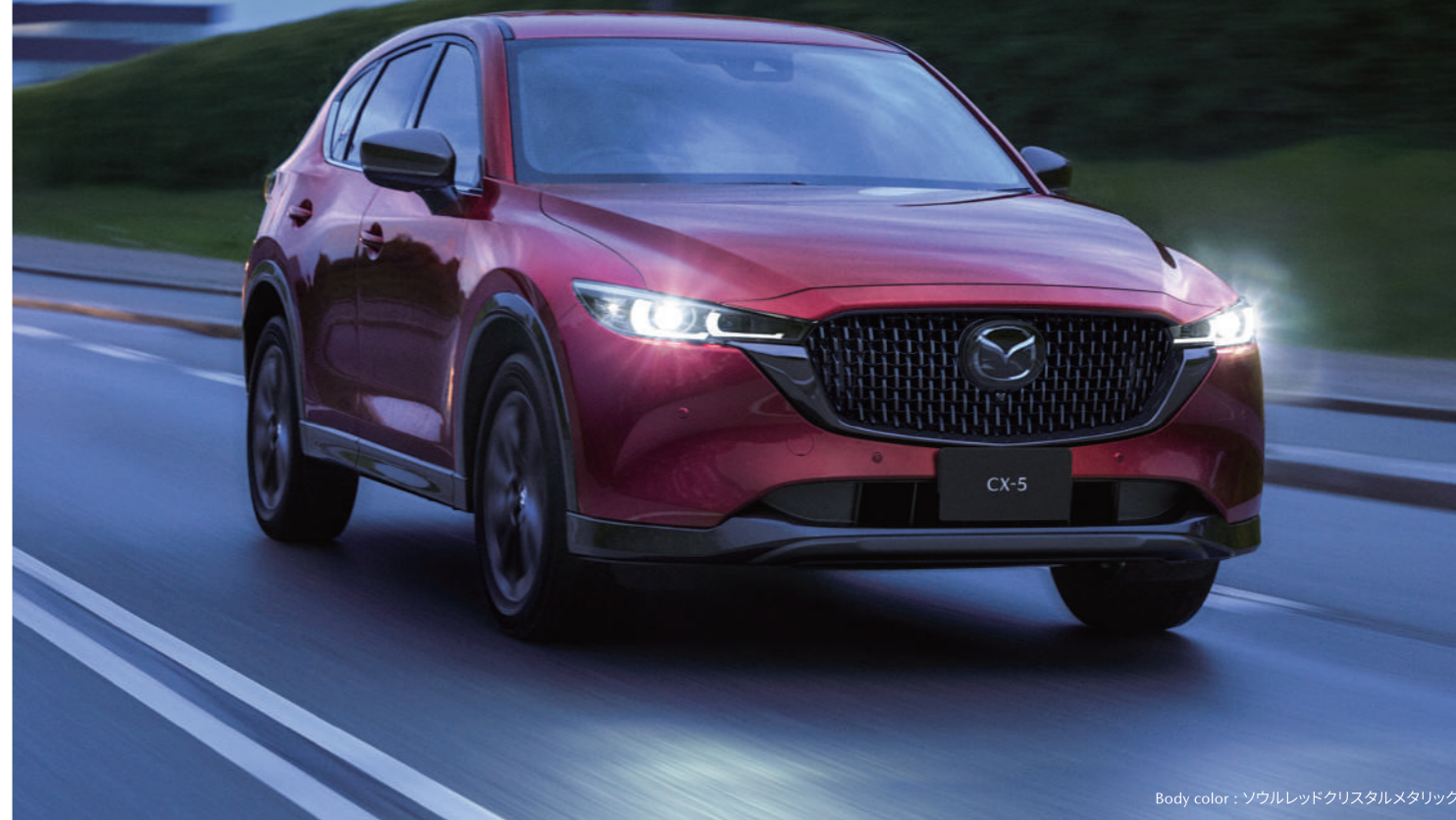
Body color : ソウルレッドクリスタルスタリック