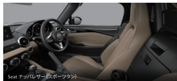
Seat ナッパレザー(スポーツタン)

Body color ジェットブラックマイカ ソフトトップカラー: ベージュ(インシュレーター付)