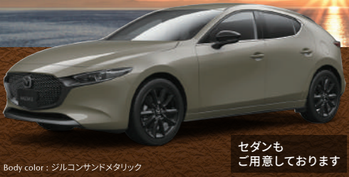
Body color : ジルコンサンドメタリック

【特別仕様車】 FASTBACK 20S Retro Sports Edition (ハイブリッド[e-SKYACTIV G]) 車両本体価格(消費税込) ¥2,984,300 e-SKYACTIV G 2.0/6速AT/2WD[R28-G1-0] セダンも ご用意しております