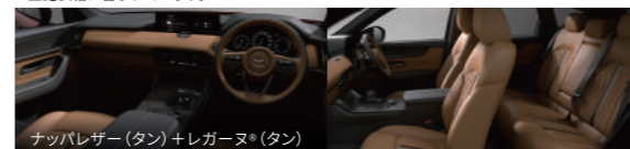
ナッパレザー (タン) + レガーヌ* (タン)

※写真掲載色マシーングレープレミアムメタリックは特別塗装のため、55,000円 (消費税込) 高。上記価格に含まれています。