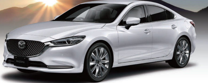
Body color ロジウムホワイトプレミアムメタリック

SEDAN 25S L Package (ガソリンエンジン) 車両本体価格(消費税込) ¥3,913,800 SKYACTIV-G 2.5/6速AT/2WD[C24-C4-0] ※写真掲載色ロジウムホワイトプレミアムメタリックは特別塗装色のため、55,000円(税込)高。上記価格に含まれています。 MAZDA6は 車両本体価格(消費税込) ¥2,962,300 から(20S 6AT 2WD)