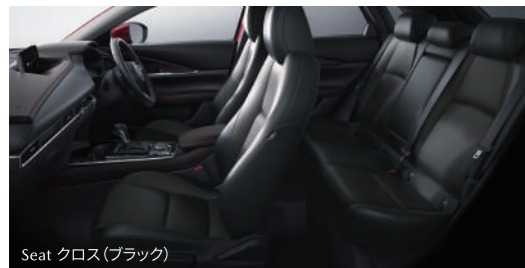
Seat クロス (ブラック)