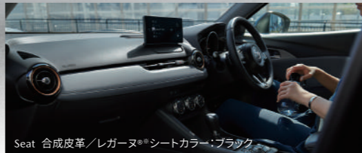
Seat 合成皮革/レガージュ※シートカラー:ブラック