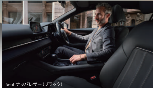
Seat ナッパレザー(ブラック)