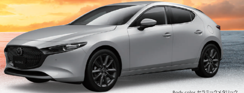
Body color セラミックメタリック

FASTBACK 15S Touring (ガソリンエンジン) 車両本体価格(消費税込) ¥2,498,100 SKYACTIV-G 1.5/6速AT/2WD[R12-B1-0] MAZDA3は 車両本体価格(消費税込) ¥2,288,000 から(15S 6AT 2WD)