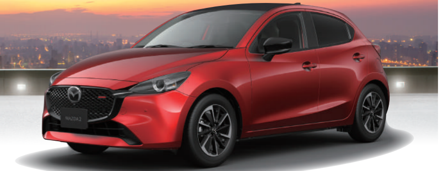
Body color ソウルレッドクリスタルメタリック