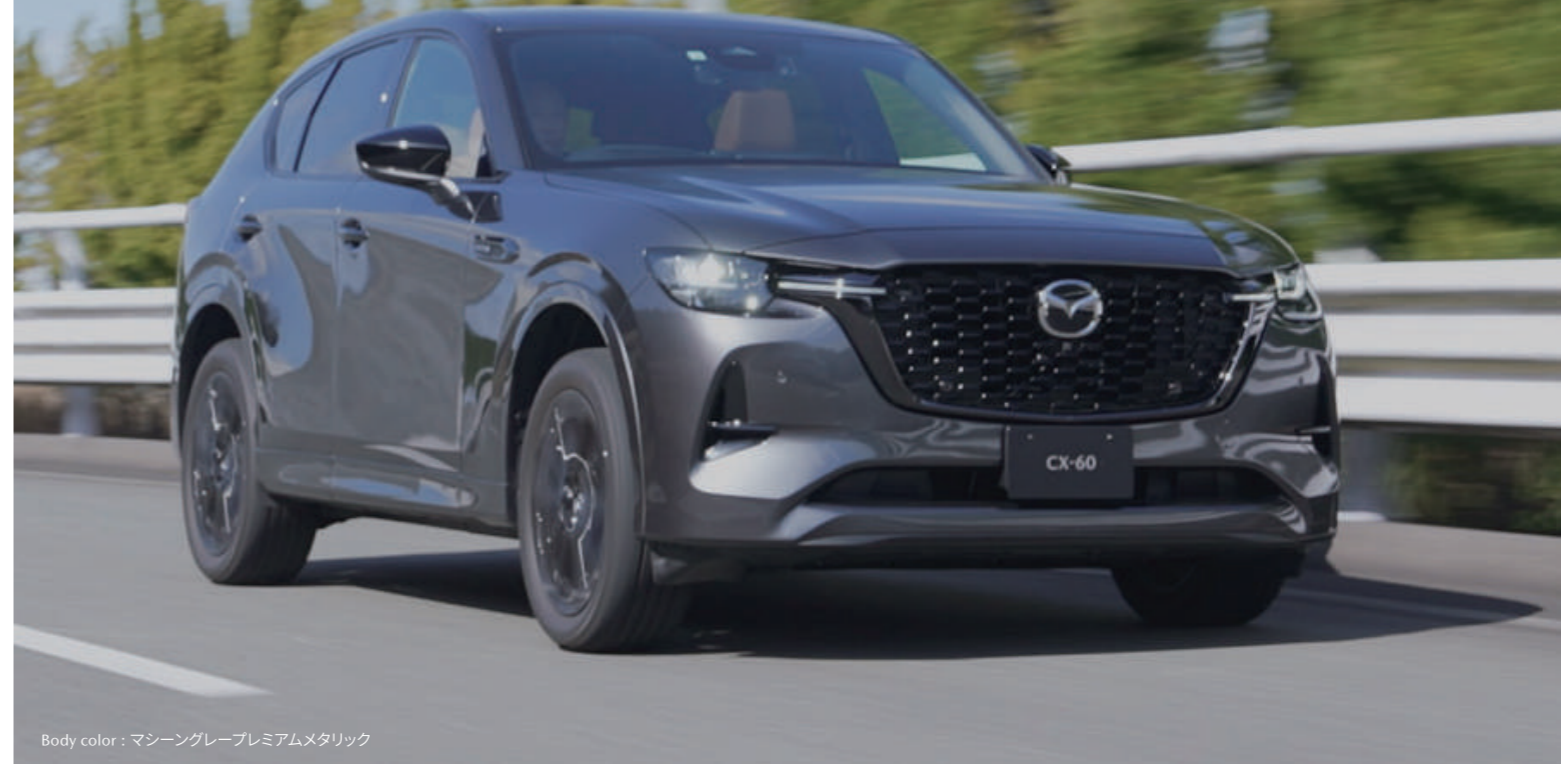
Body color : マシーングレープレミアムメタリック