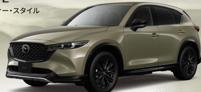
Body color: ジルコンサットメタリック