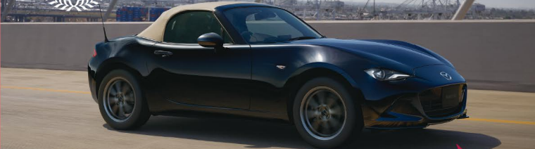
Body color: シェットブラックマイカ